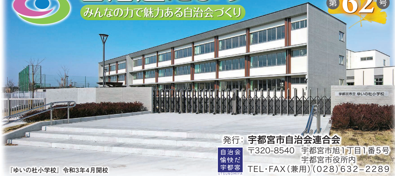
「ゆいの杜小学校」 令和3年4月開校