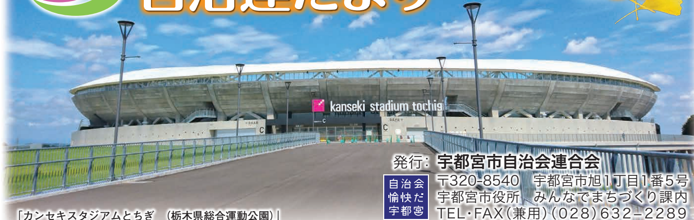
「カンセキスタジアムとちぎ（栃木県総合運動公園）」